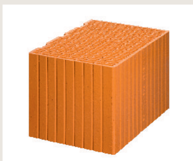
Nr artykułu 0913