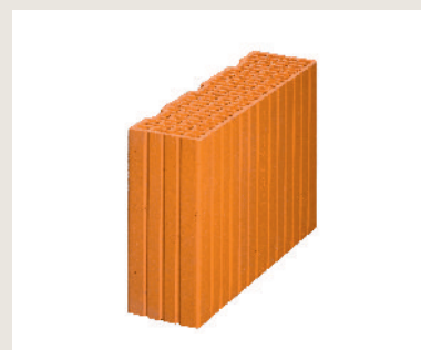
Nr artykułu 1005