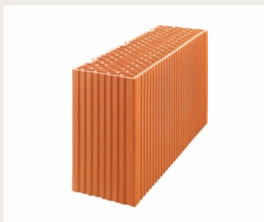
Nr artykułu 0907