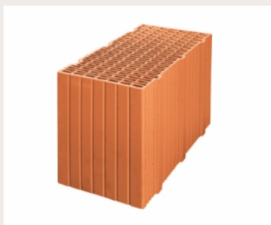
Nr artykułu 0912