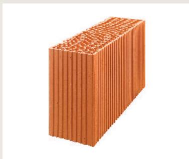
Nr artykułu 1008