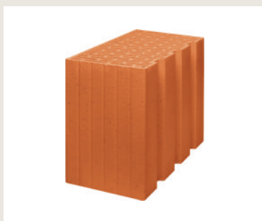
Nr artykułu 1307