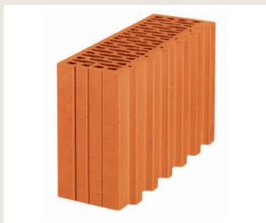
Nr artykułu 2606