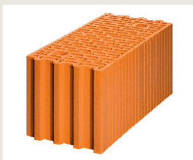
Nr artykułu 2826